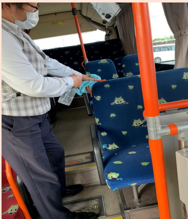
1運行ごとに車内消毒を実施しております