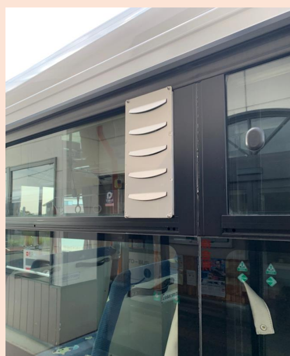
雨天時でも窓からの外気導入が可能であるバイザーを一部車両に設置しており順次設置台数を拡大して行きます