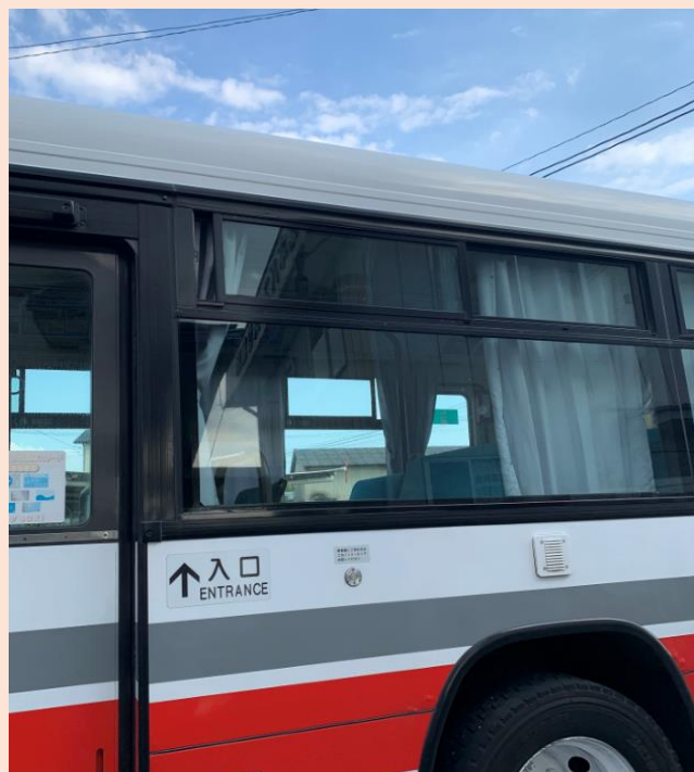
運行中は窓を開け換気を行っております