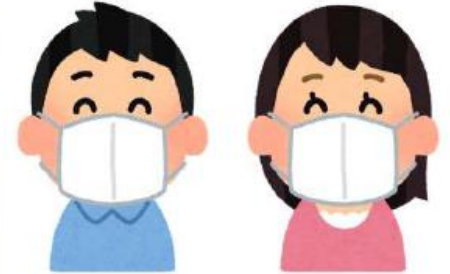
乗車時のマスク 着用をお願い