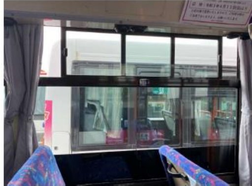
換気扇、窓開け等 による車内の換気